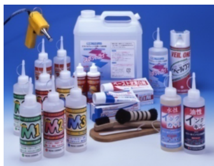
クリーニング向け 業務用シミ抜き剤各種