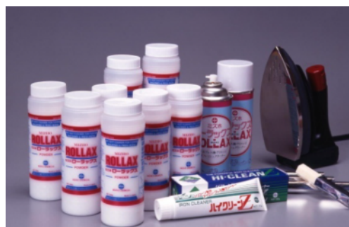
世界の縫製工場向け 接着芯地樹脂除去剤