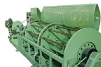
機器再生業務により蘇った機械(左:再生前、右:再生後)