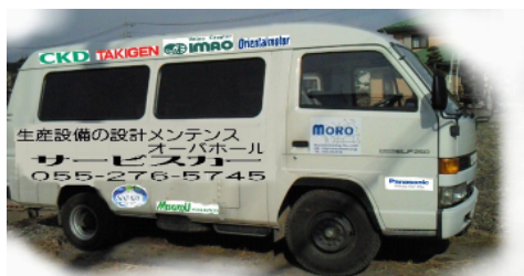
自社メンテナンスカー

同社は、本年、隣接する韮崎市に大規模な工場を取得し、事業拡大を図る予定である。また、地域の小学生から高校生に至るまでの会社見学・インターンシップの受け入れや、職能高校からの依頼による講師派遣を積極的に行う等、次世代のものづくり人材育成を従業員一丸となって取り組んでいる。また、地元における雇用創出への意欲も高く、将来的には女性の製造技術者の就業を促すため、社内に育児施設を設置することも検討している。