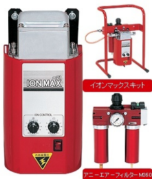
無帯電塗装装置イオンマックス

同社は、国内の主な自動車メーカー向けの特殊工具やリコール対策部品を製造・供給している。この分野は、一般的な量産品と違い、「少数・多品種・短納期」のものが多く企業努力が必要な分野であるが、これらのニーズに応える取り組みを行ってきており、自動車メーカーのモノづくりを陰で支えている。