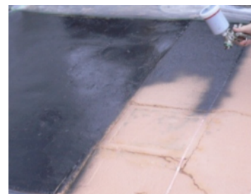
発熱塗料 施工風景