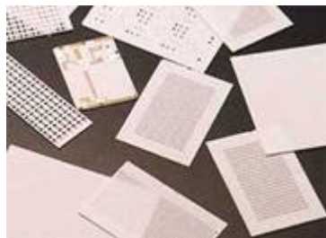
アルミナセラミックス基板

アルミナ基板の製造技術を活かして、「高輝度チップLED用アルミナセラミックパッケージ」の開発にも成功した(特許製品)。現在の各種電子機器用の蛍光灯光源に代わる次世代の高輝度光源としての期待が高いLED用のアルミナセラミック製パッケージであり、多くのエレクトロニクスメーカーから高い評価を受けている。