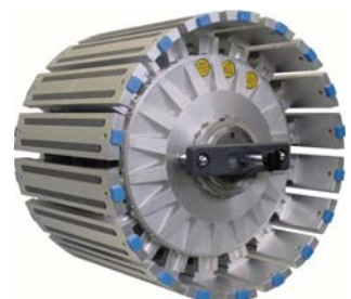
(タイヤ成型ドラム)