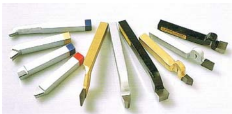
ハイスバイト・超硬バイト

長年培った技術ノウハウを活用することにより、常に新分野進出等の事業拡大に注力。近時では、大型船舶用ディーゼルエンジンの心臓部であるクランクシャフトの加工等、大物の精密加工向け「ハイス(高速度鋼)バイト」のインサート化(刃先部分の交換を可能化)を実現。一品生産かつ特殊形状の精密加工が求められる同市場において、精密加工を得意とする「ハイス(高速度鋼)バイト」を低コストで早期交換することが可能となることで、生産コストの低減化・品質の安定化をもたらしている。