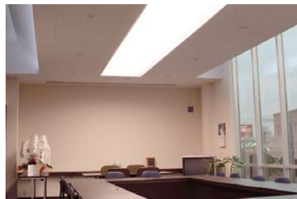
すべての照明にLEDを採用した会議室

同社は創業者が大手電子部品メーカー退職後、当社を設立。LEDの将来性に期待し、フルカラーLEDを他社に先駆けて開発。フルカラーチップLEDやその応用製品が主力商品となった。現在は、白色LEDを使った照明製品の開発・製造・販売にも力を入れている。