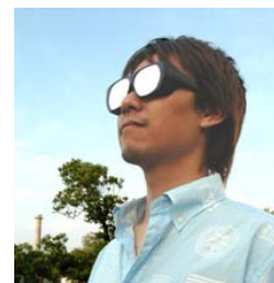
色弱模擬フィルタ「ハリアントール」