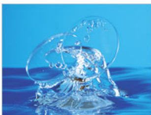
プラスチックレンズイメージ画像

同社は、かけて見るだけで色弱者の色の見分けにくさを一般色覚者が体験でき、配色チェックを可能とする世界初の眼鏡型特殊フィルタ（色弱模擬フィルタ）を、豊橋技術科学大学、高知工科大学、(株)サイエンス・クリエイト（管理法人）とともに、共同開発し、製品試作に成功。経済産業省の推進する産業クラスター事業で実施した「視覚科学シンポジウム」を契機に培った企業、研究者とのネットワークを活かし、教育、医療、印刷、電機電子といった新たな事業分野に展開している。