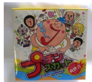
プチプチの感覚を再現した『∞(むげん)プチプチ』(左)と ひまつぶし専用プチプチ『プッチンスカット』(右)