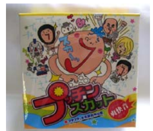
プチプチの感覚を再現した『∞(むげん)プチプチ』(左)と ひまつぶし専用プチプチ『プッチンスカット』(右)