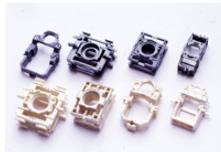
製品名：レンズホルダー 用途：DVDピックアップ部品