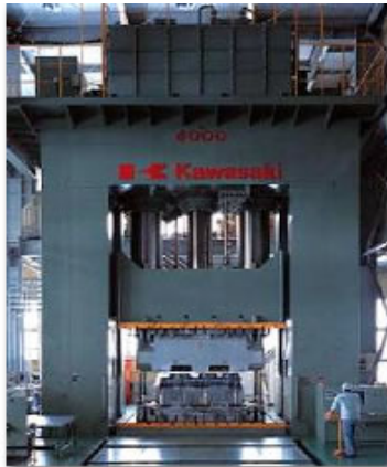
世界最大級4150tプレス機▶