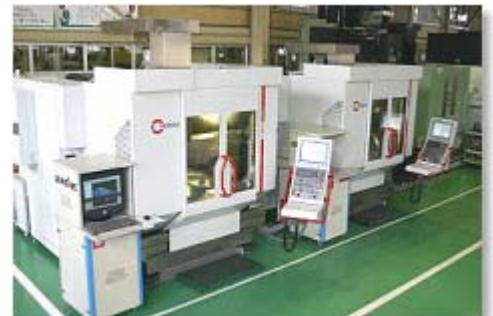
▲5軸加工機 15台以上設備