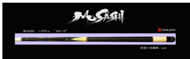
新工法を採用したブランド「MUSASHI」