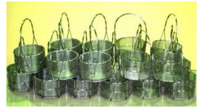
職人技のステンレスメッシュカゴ

同社は、メッキ用引っ掛け治具、塗装用治具、洗浄用カゴ、熱処理用カゴなど、塗装・洗浄・熱処理用等表面処理に使用される治具を製造。優れた生産技術と最新設備を駆使して送り出される各種治具製造は、客先から高い信頼を得ている。