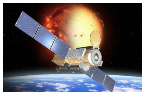
太陽観測衛星「ひので(SOLAR-B)」