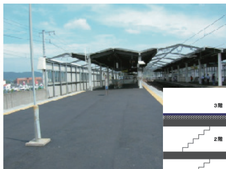
▲ プラットホーム施工後全景