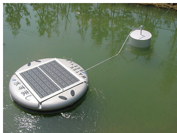
浮体式水質浄化装置 「水すまし」

先進性、メンテナンスの容易性、経済性等が評価され、2001年4月にWFEO(世界エン 지니어リング機関連盟)から世界で4社のうちの1社に選ばれ、ニューヨーク国連本部で開か れたUNCSD技術フォーラムでプレゼン テーションを行った。