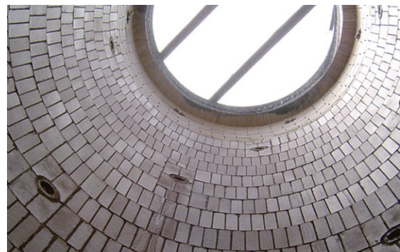
耐酸煉瓦施工例(缶体)