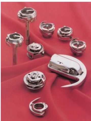
【様々なニーズに対応する製品】

かまはミシンの最も重要な部品。針から供給される上糸をかまが捕捉し、かまの回転により上糸をかまの周りを一周させ、かまに収納されたボビンの下糸との間で縫い目を作る。株式会社広瀬製作所は、このミシンの心臓部品である工業用マシン全回転かま（フック）の世界シェアナンバーワンのトップメーカーとして世界の縫製産業をささえている。