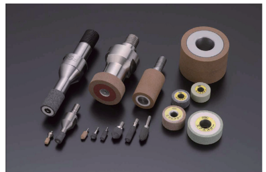
自動車向け等の高精度超砥粒研削砥石