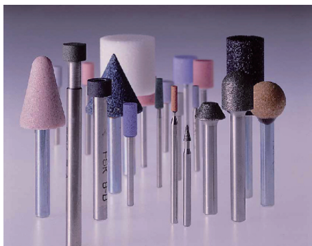
さまざまな軸付砥石

顧客ニーズの分析とさまざまなテストによって、加工対象物の種類・硬さ、加工部分・加工形状、加工機械の状況などを調べ、顧客ニーズにあったオンリーワン製品を提供している。また、更に精度が要求されるIT向けの直径50ミクロンの砥石を標準在庫化し、直径40ミクロンの砥石も安定供給を可能としている。