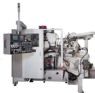
片岡機械製作所が製作する ピストンリング加工専用機

専用機には全て最先端のコンピュータ技術と独自のノウハウ（インテリジェントメカトロニクス）が組み込まれている。創業以来築き上げてきたコア技術・ノウハウをベースに、地球環境に優しい次世代エンジンの開発を旋削や研削技術から支えるべく、『ひるむことのない開発』を続けている。