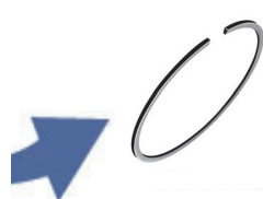
ピストンリングは エンジンのピストン 部分に使われています