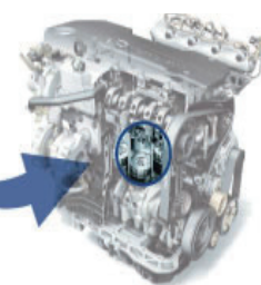
エンジンとエンジン内の ピストンリング