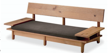
節を生かした家具 「森のこぼば」

家具業界の常識は、節のない柾目材を使用すること。同社では、この常識に挑戦し、「節」を主役とした家具づくりに着手。予想を超えた魅力的なフォルムで、世界にひとつしかない家具として、脚光を浴びる。従来、一本の丸太から家具用材として活用できたのは、わずか10~25%だったが、「節」材の活用で25~40%に向上。