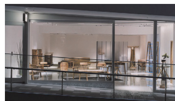
表参道ヒルズ内の「HIDA OMOTESANDO」