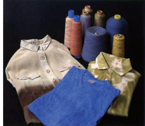
特殊染色技術を応用した製品例

従来、季節変動の大きかった繊維業界にあって、小ロットの受注を重ねることにより、受注の平準化を実現している。