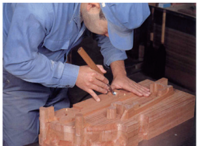
熟練技術者による木型加工