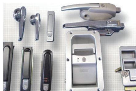
配電盤・特装車輛用ハンドル