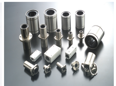
リニアベアリング