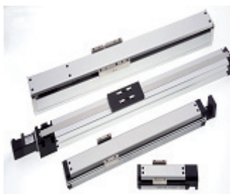
アクチュエーター