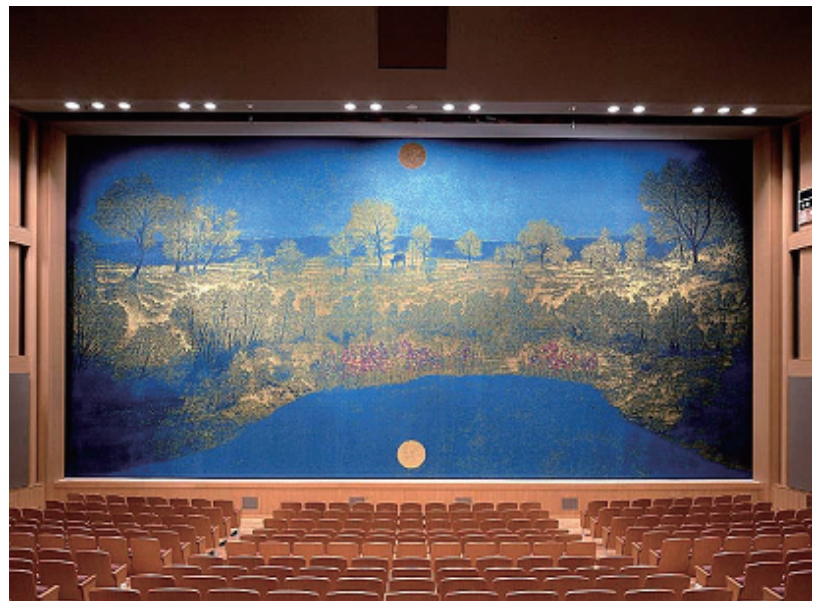
緞帳「月映る頃」(置賜文化ホール 原画: 福王寺一彦)

同社の織物は、代表であり作家でもある山口英夫社長の優れた感性によるデザイン力を表現したものであり、緞帳やタペストリーなど一品だけしか必要のない織物を短納期、低価格で提供している。一方、その織物は芸術的作品としても評価が高く、国際テキスタイルコンペティション'97京都では「内閣総理大臣賞」を受賞。また、世界三大美術館の一つである米国のメトロポリタン美術館を始め、複数の美術館にも収蔵されている。