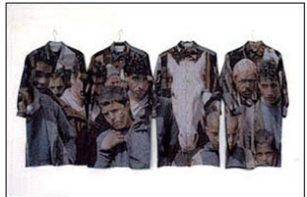
「視線」 米国メトロポリタン美術館 収蔵 (立体感を計算して1枚の原画を4着に表現)

従来の技術で写真のような織物を織るには、写真全体の色を分類し、近い色を人間が判断しながら糸を入れていく作業となるため、どうしても「絵」のような仕上がりになる。そこで、同社は、織物の柄にしたい画像をそのままコンピューターに取り込んだ上、織機をパソコンのプリンタ感覚で稼働させ、限りなく原画に近いクオリティで織物を織ることに成功した。また、人が着用した場合の立体感を計算の上で、写真を表現することや8色の糸でリアルなカラー写真織も実現した(同社特許技術)。