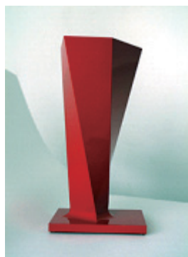
仙台のイニシャルであるSと若い躍動感、情熱の朱をコンセプトとしたサッカーの国際ユース大会の優勝トロフィー

家業である漆器から食器・インテリア・ショップデザイン・建築・アートに至るまで、“人とモノとのさらに進化した関係”をコンセプトとした作品は、欧米諸国の先駆的セレクトショップなどから高く評価され、ジョエル・ロブション等世界的なレストランからの注文を始め、イギリスのハロッズ、フランスのコレット、ドイツのダイムラークライスラー、ニューヨーク近代美術館等々、世界各国への納入のほか、スイスのネスレ社からは重要顧客向けクリスマスギフトとしての納入実績を有している。