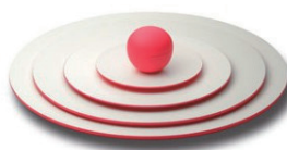
蛍光色というチープな色でファッションさえも超えたデザインのパーティー皿 (DESIGNPLUS賞受賞)