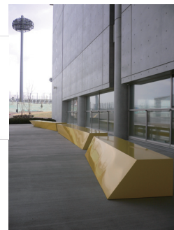
未来へ向けた躍動感がコンセプトのスポーツ施設内のオブジェ的ベンチ