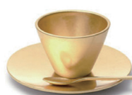
世界の伝統色のゴールドを日本の伝統芸術の金箔と最新デザインで表現した cup & saucer