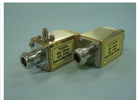
産業技術総合研究所と共同開発した交直差 1 ppm、マルチジャンクションサーマルコンバータ