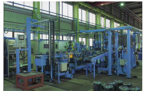
リムライン(組立ライン)

1886年（明治19年）に地元老舗卸売企業の附属工場として創業、水揚ポンプなどを製作していた。第二次世界大戦後は炭坑用人車救急車、製鉄用薄版処理プラントといった産業用機械の設計・製造を手掛け、その技術・ノウハウをもとに、1967年（昭和42年）にリムライン製造プラントの分野に進出。顧客のニーズに対応したオーダーメイドでの生産ラインの設計・製造を行っている。