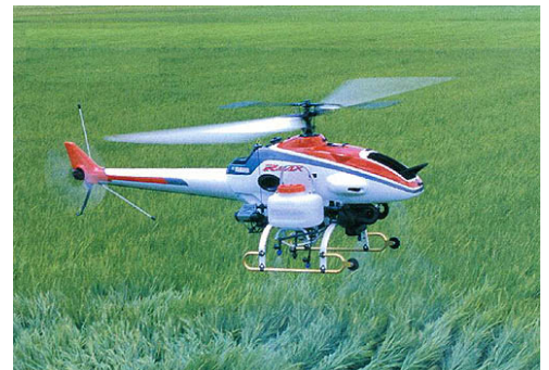
農業用無人ヘリコプター