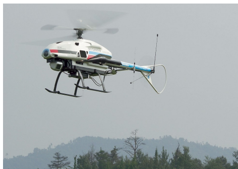
自動制御無人ヘリコプター

ヘリコプター技術を積極的に進化させ、大手二輪車メーカーと共同で開発した農薬散布用小型ヘリコプター、電力会社の送電線の巡視・点検や防災監視などへの利用が期待される自動制御無線ヘリコプター、カンボジアでの地雷除去用無人ヘリコプター等次々と開発が進められるなど、ホビーから産業用まで活躍の場が広がっている。