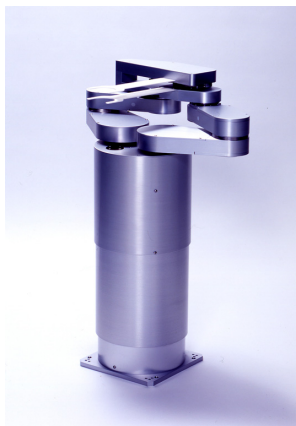
ウエハ搬送ロボット

グローバルな事業展開を積極的に進めており、米国、韓国、台湾などに拠点を有し、各国のユーザーのニーズに合わせた開発、製造、販売、サービスを提供している。また、国際分業の生産拠点としてベトナムに早い段階から進出、同国のハイテク企業第1号の認定を受けている。標準品や汎用部品を生産しローツエグループ各社に供給している。