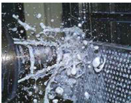
従来の加工(水溶性切削油剤)

ドリルの主軸内部でのミキシングを行う方法は世界で同社のみの技術。日本だけでなく米、 独、韓の海外特許も取得。平成8年にマシニングセンタで世界初のドライ切削システムの本格 生産を開始した。国内自動車メーカーだけでなく、その海外進出工場や、海外自動車メーカ ーにも当社のドライ切削工作機械を納入しており、自動車部品加工用では世界トップシェア。ま た、海外市場での販売力強化のため、タイ、米国、フランスに現地法人を順次設立している。