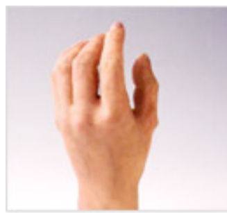
シリコンゴム製人工補正具