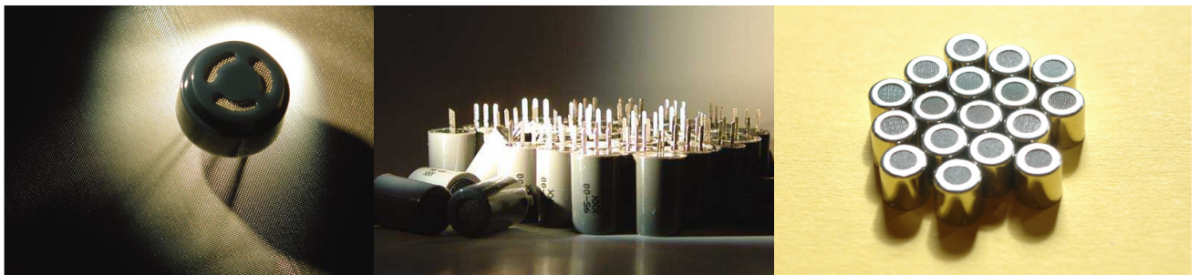
ガス漏れ検知から空気質の微量ガス検知まで幅広い用途に品揃え

半導体ガスセンサは世界的にも数社程度しか扱っておらず、同社の高い技術力・商品開発力を背景に、大手メーカーから共同研究の依頼あり。また、同社が次世代の半導体ガスセンサとして商品化したSB、SPシリーズは、感度、応答速度、長期安定性、メンテナンス、経済性、省電力性、複合・集積化に優れており、応用分野拡大に大きな可能性を持つ。