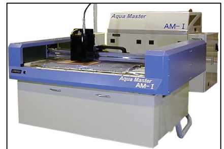
ウォータージェット加工機 AM-I

アジア企業の台頭による危機感や国際競争力強化の観点から次世代レーザーとして期待されているフェムト秒レーザーを含む、自動機の技術開発について大学との共同研究も進めている。また、インターンシップ学生の受け入れも積極的に推進している。