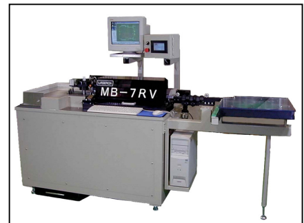
抜型用刃物自動曲げ機 マスターベンダー