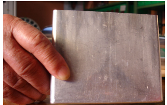
ハイブリッドカー用電池ケース

ハイブリッドカー用電池の小型・軽量化のためには、リチウムイオン電池と、アルミニウムを一体成形した電池を収めるケースが必要。 岡野工業株式会社では、一枚の金属の板を限界までプレスし、金属版を破断させることなく徐々に薄く深いケースに仕上げている「精密深絞り技術」により、1枚のアルミニウム板から厚さ0.8mm以下、加工精度10μm(1/100mm)の電池ケースを作ることに成功。