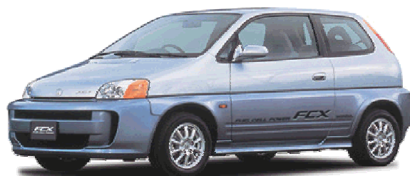
大手自動車メーカー燃料電池自動車

岩手大学の知と国・県の支援を受けて開発した株式会社東亜電化のオンリーワン技術は、その多くのノウハウを特許取得により権利確立している（特許出願中7件、取得済4件）。研究成果の知財戦略化を進める経営方針のもと、大手企業などの高機能製品の製造を支える重要なパートナーとして活躍している。