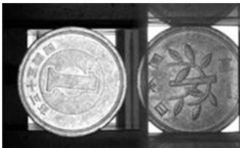
【二面クロビット】表裏を見るためのクロビット

独自の製造ノウハウを確立した社長自ら理論的に若手技術者を教育することにより、平均年齢が30歳前後の若手技術者集団でありながら、プリズム加工における熟練の技を可能とした。